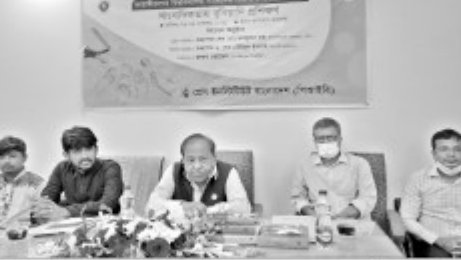
জাৰি বৰ্তিবি প্ৰতিষ্ঠিত ৯৩ বছৰীয়া 'মহাশয়িত' নামৰ এখন বিশাল 'স্মৃতিস্তম্ভ'ৰ স্মাৰক হিচাপে ২৬ নভেম্বৰ দিনক 'নাঙ্গাইল শহীদ দিবস' আৰু 'মহাশয়িত দিবস' হিচাপে পালন কৰা হ'ব।

৯ জৰি বৰ্তিবি প্ৰতিষ্ঠিত ৯৩ বছৰীয়া 'মহাশয়িত' নামৰ এখন বিশাল 'স্মৃতিস্তম্ভ'ৰ স্মাৰক হিচাপে ২৬ নভেম্বৰ দিনক 'নাঙ্গাইল শহীদ দিবস' আৰু 'মহাশয়িত দিবস' হিচাপে পালন কৰা হ'ব।